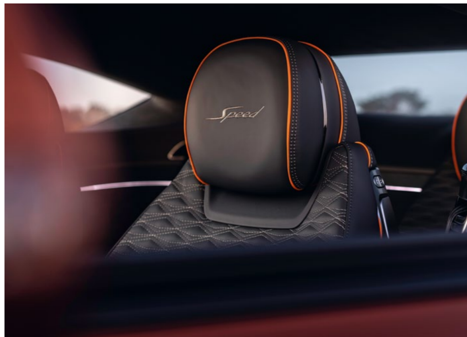
Continental GT Speed (Hybrid): WLTP-Fahrzyklus: Energieverbrauch gewichtet kombiniert – 1,3 l/100 km und 27,7 kWh/100 km. Kraftstoffverbrauch bei entladener Batterie kombiniert – 10,3 l/100 km. CO 2 -Emissionen kombiniert – 29 g/km. CO 2 -Klasse – G. Stand: 02/2025.